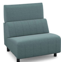
E150 (86 cm x 95 cm x 100 cm) (24 kg / 1 pcs)