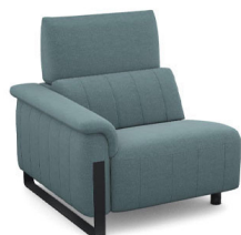
B100L (86 cm x 95 cm x 100 cm) (33 kg / 1 pcs)