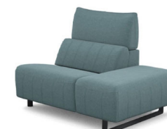
IS00R (100 cm x 91 cm x 134 cm) (37 kg / 1 pcs)