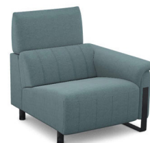
B100R (86 cm x 95 cm x 100 cm) (33 kg / 1 pcs)