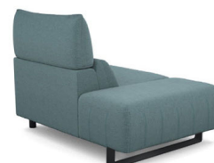
IS00L (100 cm x 95 cm x 134 cm) (37 kg / 1 pcs)