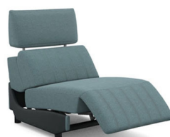
E150EL (86 cm x 95 cm x 100 cm) (52 kg / 1 pcs)