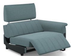
B150ER (107 cm x 95 cm x 100 cm) (63 kg / 1 pcs)