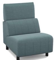
E100 (65 cm x 95 cm x 100 cm) (22 kg / 1 pcs)