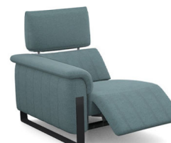
B100EL (86 cm x 95 cm x 100 cm) (56 kg / 1 pcs)