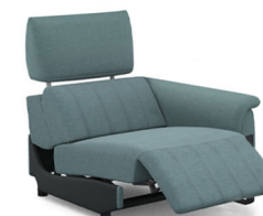
B100ER (86 cm x 95 cm x 100 cm) (56 kg / 1 pcs)