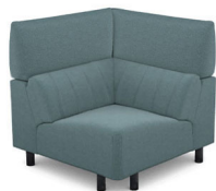
E100L (100 cm x 95 cm x 100 cm) (32 kg / 1 pcs)