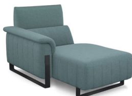
CH00L (100 cm x 95 cm x 160 cm) (45 kg / 1 pcs)