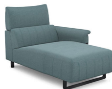
CH00R (100 cm x 95 cm x 160 cm) (45 kg / 1 pcs)